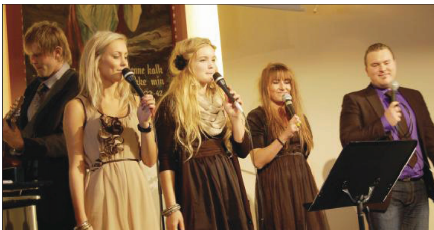
Lovsangteamet presenterte ung sang og rytme.