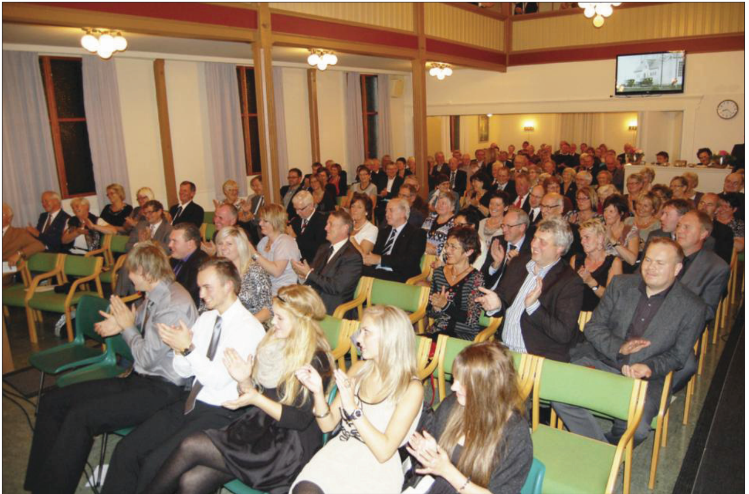
En feststemt forsamling takker for gode ord og gaver til jubilaranten.

Den livsfriske jubilaranten, Bedehuset Betel i Vedavåg har i sannhet mye å feire. Men en runder ikke 100 helt uten motgang. Noen brottsjører har det vært, det meste minnes som vekst og velsignelse.