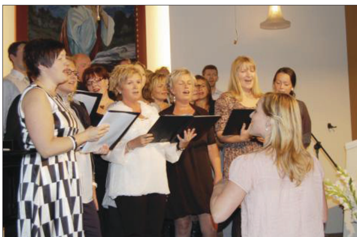
Gledesbudet befestet bredden i sang- og musikklivet på Betel.