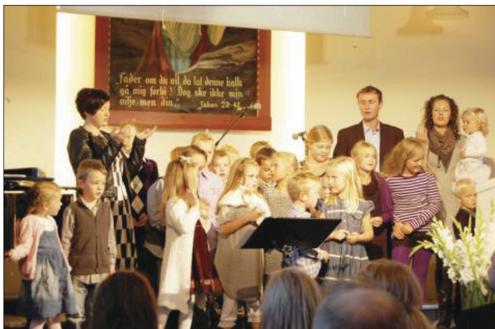
Søndagsskolen fikk æren av å åpne festen.